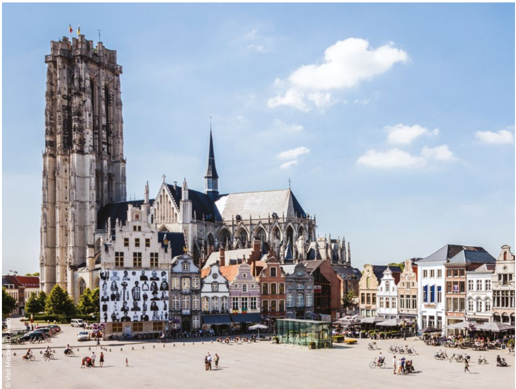
Mechelse Sint-Romboutkathedraal met één van de 26 Vlaamse belfortorens

Unesco's Werelderfgoed-conventie uit 1972 geeft het kader om uitzonderlijke culturele en natuurlijke sites als Werelderfgoed te erkennen en te beschermen. Men beoordeelt een plaats op basis van een reeks criteria voor de authenticiteit, de integriteit, de beschermings- en beheersmaatregelen, en bovenal de uitzonderlijke universele waarde. Intussen staan er meer dan 1100 sites op de Werelderfgoedlijst, waaronder ook zes in Vlaanderen. Een Werelderfgoed kan uit één individueel object bestaan (bv. het Vrijheidsbeeld in New York), maar kan ook een serie van zelfs meerdere honderden aparte gebouwen of sites omvatten (bv. de pelgrimsroute naar Santiago de Compostella in Spanje). Eenzelfde Werelderfgoed kan ook in meerdere landen liggen (bv. de Waddenzee, die zich uitstrekt over Nederland, Duitsland en Denemarken).