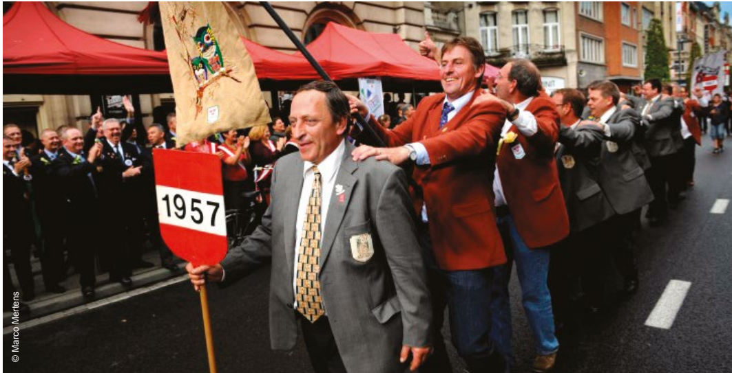
Jaartalleven Leuven 2010