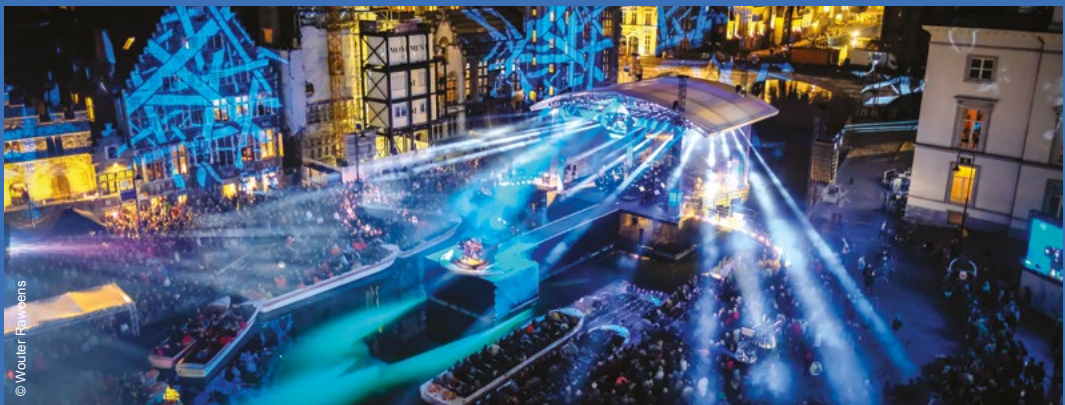
Gent Unesco Creative City of Music - OdeGand

In 2004 lanceerde Unesco het netwerk van Creatieve Steden om samenwerking te stimuleren tussen steden die sterk bezig zijn op vlak van creativiteit bij hun duurzame stedelijke ontwikkeling. Steden kiezen binnen het netwerk voor een specifieke focus op literatuur, muziek, ambachten en volkskunst, film, mediakunsten, gastronomie of design. Gent trad al in 2009 toe als creatieve stad voor muziek en Kortrijk volgde in 2017 als designstad.